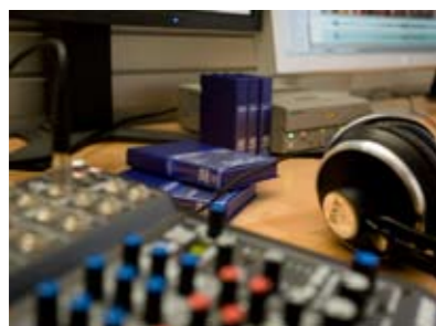
Ob im Studio oder On Location – professionelles Equipment unterstützt Ihre Idee/Produktion

Die Folge: Immer mehr Unternehmen nutzen diese Möglichkeiten, um sich und ihre Leistungen noch anschaulicher zu präsentieren. Imagevideos, Produktdemos, e-Learning und Online-Movies oder Videopodcasts