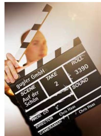
Spot an, Ton ab, Kamera läuft...und bitte!

Bei Filmen, die das Selbstverständnis moderner Unternehmen transportieren sollen, ist ein professioneller Look auf höchstem Branchenstandard gefragt.