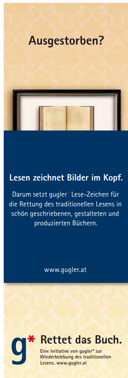
Lesezeichen mit Banderole