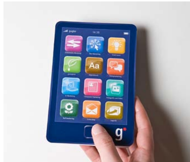
Cover Mailing (zusammengeklappt)