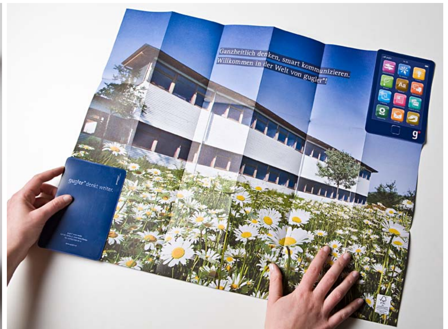
Mailing Rückseite (aufgeklappt)