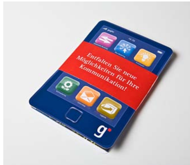
Cover Mailing (zusammengeklappt) + Banderole